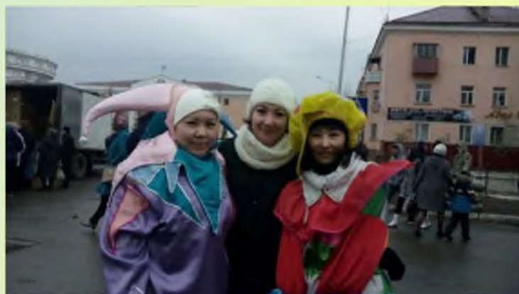
Ярмарка "Ауыл Береке - 2017"