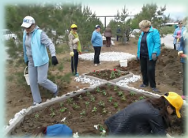
Акция "Цветущий Абай"