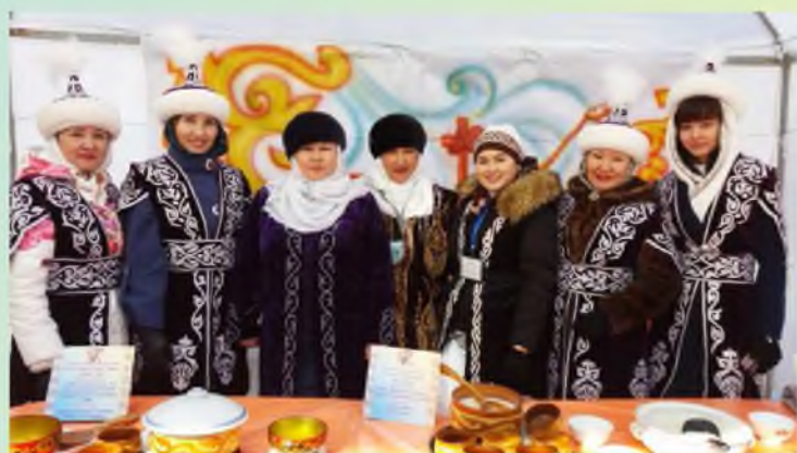
Фестиваль Наурыз көже -2017