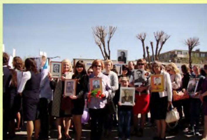
9 мая - Бессмертный полк