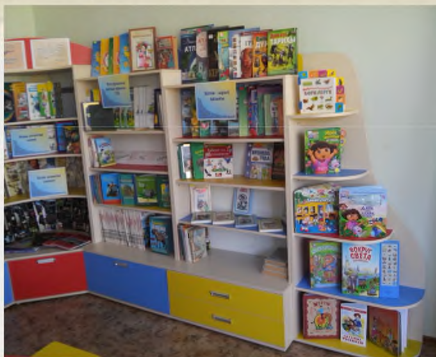
Уголок детского чтения и творчества в библиотеке пос.Южный