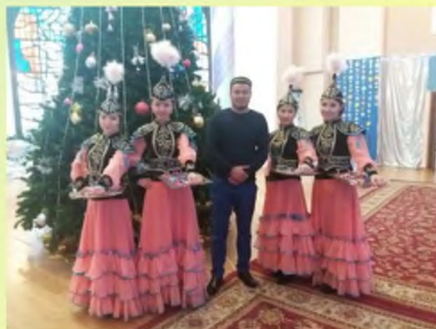
Мәуліт мерекесі -2017