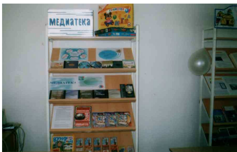
В библиотеке формируется фонд электронных документов.