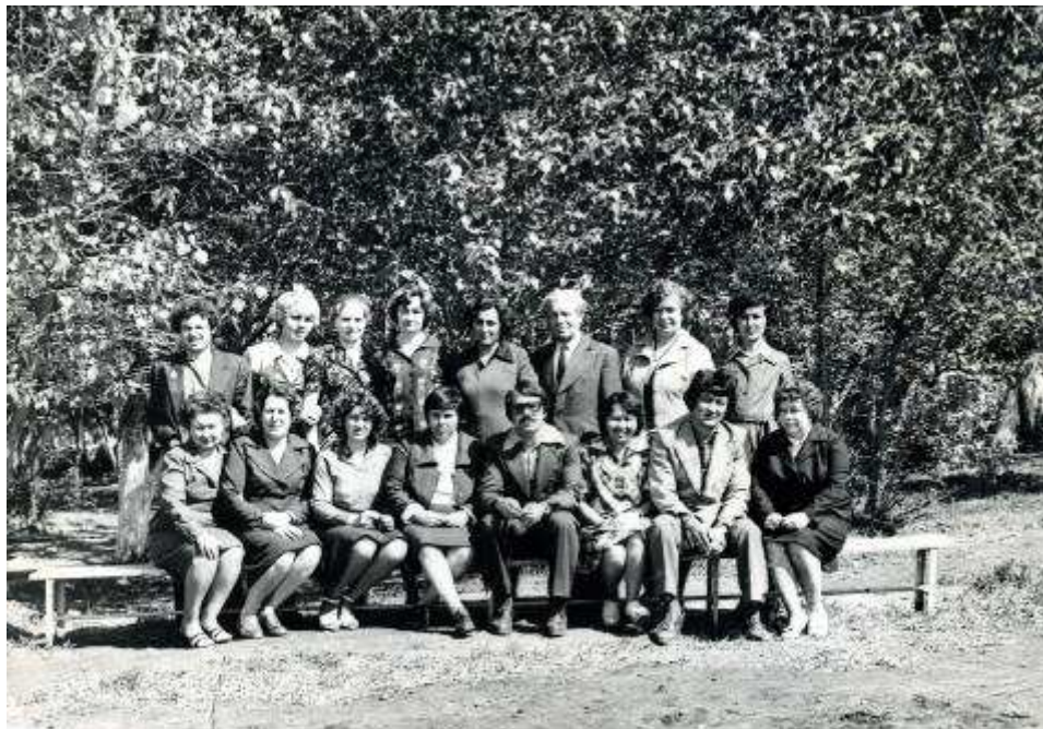
Коллектив сш № 5. 1980 год

Школа по техническим причинам была закрыта в 1997 году, и коллектив школы – педагоги и учащиеся – перешли в среднюю школу № 15, которая была открыта в п. Карабас 1968 году.