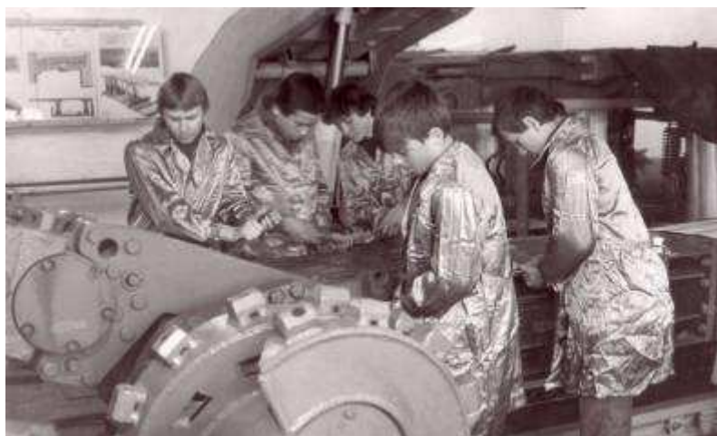
На фото: учащиеся изучают горный комбайн