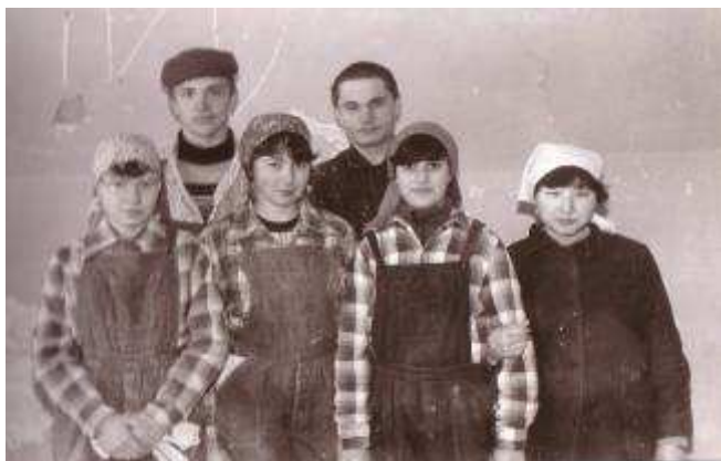
На фото: 1986 год. Участники конкурса штукатуров-маляров