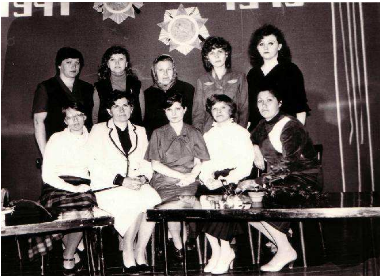
На фото: коллектив дома пионеров 1991 год

Для детей работали летние пионерские лагеря. Популярным для детей нашего города был пионерский лагерь «Юбилейный».