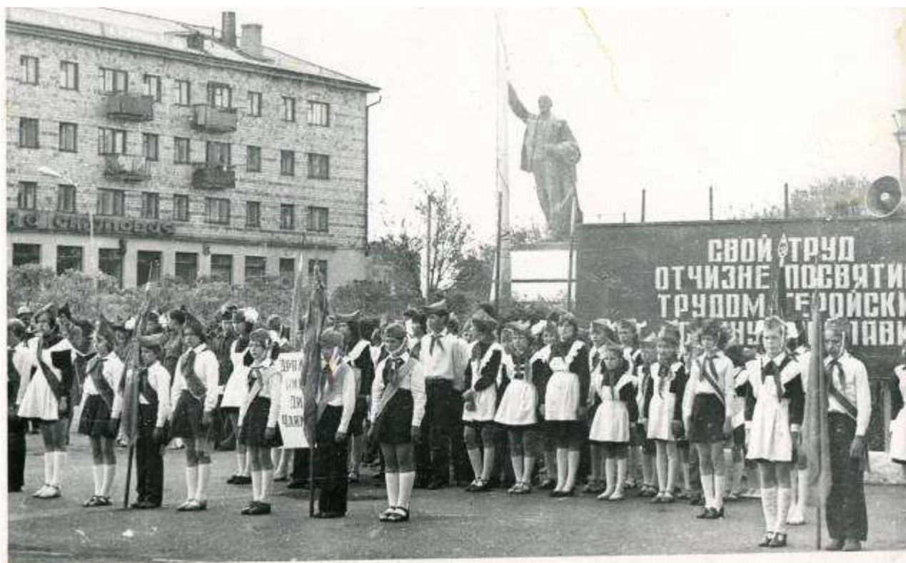
День пионерии. На центральной площади пионерские дружины школ города 1982 г.