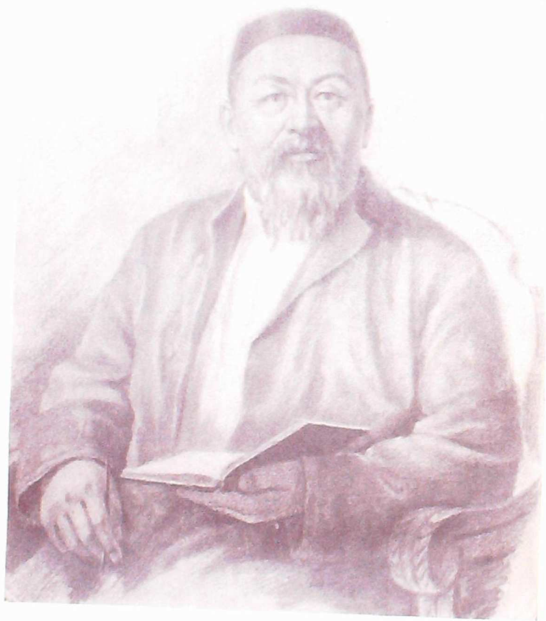
АБАЙ КУНАНБАЕВ Рисунок художника А. М. Мартовой