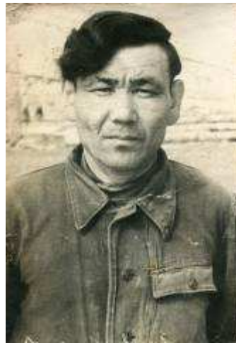
1950 год бригадир управления Долинскшахтострой