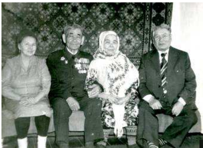
На фото: золотой юбилей 1990год 10 марта