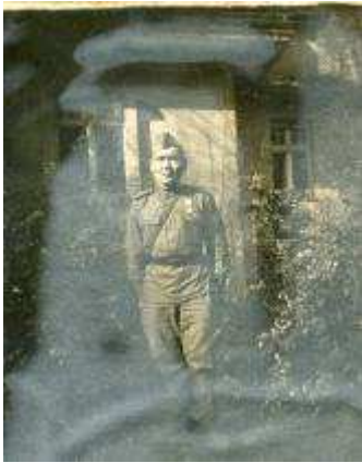
25 марта 1945 г. На пути в Берлин