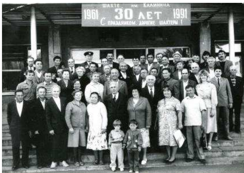
На юбилее шахты