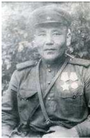
Май 1945 Берлин