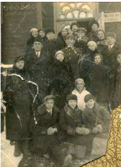
На фото: 1938 г. в Куйбышевской обл. Ворошиловский стрелок

11 июля 1941 года Сталинским райвоенкоматом г.Караганды был призван в действующую армию, воевал в составе 411 артиллерийского полка 86 тяжелой гаубичной артиллерийской бригады, 8-й Краснознаменной Калининградской артиллерийской дивизии в составе войск Калининского и 1-го Белорусского фронтов. Принимал участие в боях на Курской дуге, в боях за освобождение Украины, Белоруссии, Польши, Висло-Одерской операции, в штурме и взятии Берлина. С боями дошел до стен рейхстага.