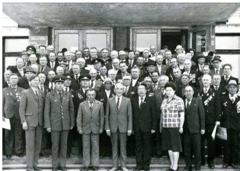
Ветераны - 40лет Победе