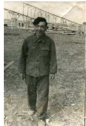
1950 начало строит. шахты 6-7