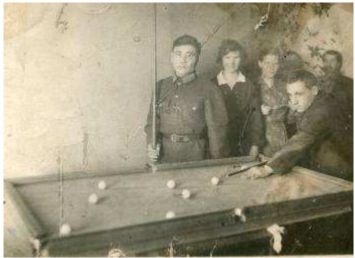
25.12.1938 г. После службы