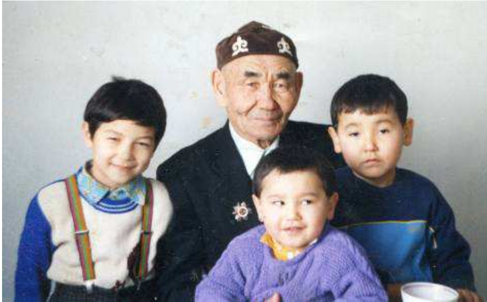
С внуками 2000 г.