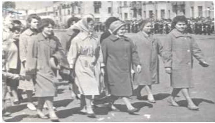
Первые выпускники средней школы № 1